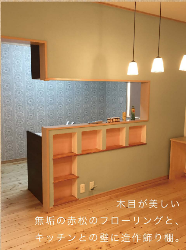
木目が美しい 無垢の赤松のフローリングと、 キッチンとの壁に造作飾り棚。