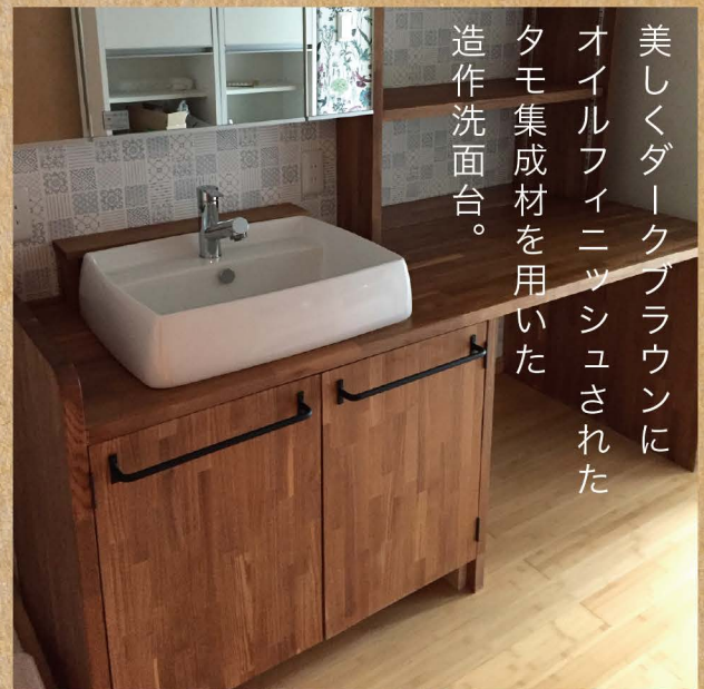
美しくダークブラウンに オイルフィニッシュされた タモ集成材を用いた 造作洗面台。

お施主様、4人家族のご自宅のリノベーション。旦那様は、 木材仕様での仕上がりに強くこだわられ、奥様は、はな やかで明るいデザインを希望されていました。壁は淡い グリーンを用いて。キッチンとの壁にも造作飾り棚を。