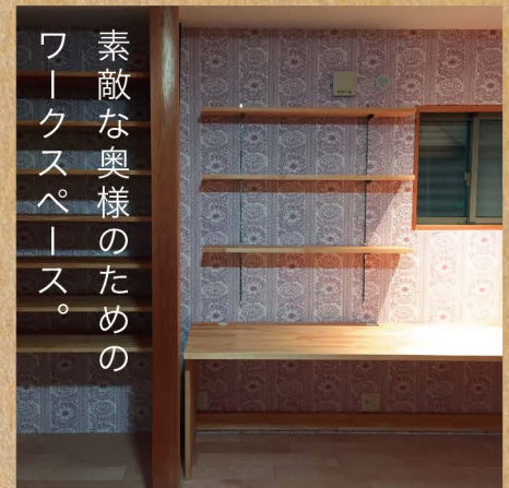
素敵な奥様のための ワークスペース。

スイートな明るく淡いピンクとホワイトの、スイス漆喰の壁。ガーリーなシャンデリアが映えるドリーミーな空間に心が弾みます。キッチンも、IH やレンジフードも新しく入れ替えられました。華やかなパープルの壁と木材で構成された落ち着いた空間の素敵な奥様のためのワークスペース。奥様には壁クロス選びも積極的に参加していただきました。