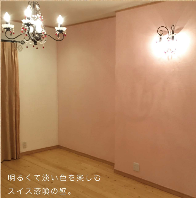
明るくて淡い色を楽しむ スイス漆喰の壁。

スイートな明るく淡いピンクとホワイトの、スイス漆喰の壁。ガーリーなシャンデリアが映えるドリーミーな空間に心が弾みます。キッチンも、IH やレンジフードも新しく入れ替えられました。華やかなパープルの壁と木材で構成された落ち着いた空間の素敵な奥様のためのワークスペース。奥様には壁クロス選びも積極的に参加していただきました。