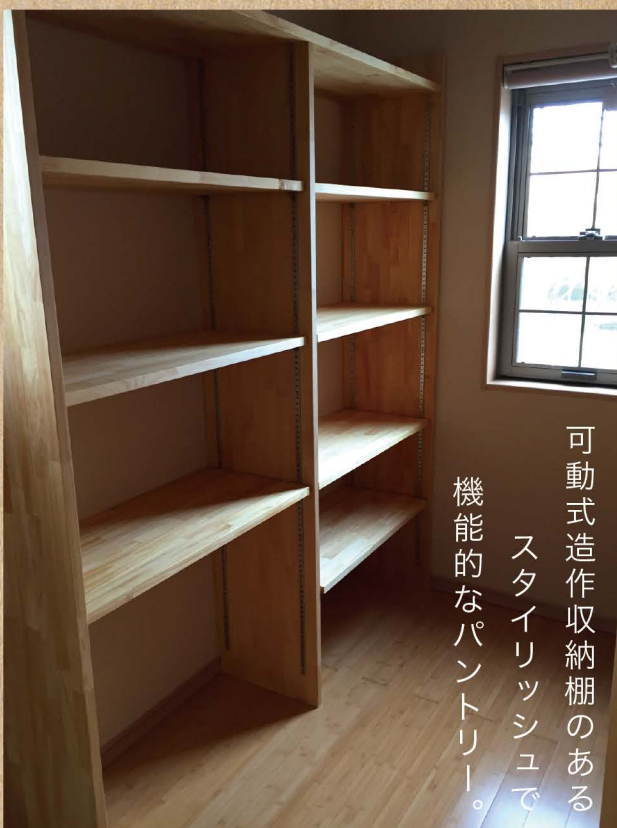
可動式造作収納棚のある スタイリッシュで 機能的なパントリー。